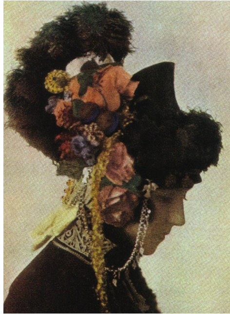
Κεφαλόδεσμος Γιδά (Ρουμλούκι)