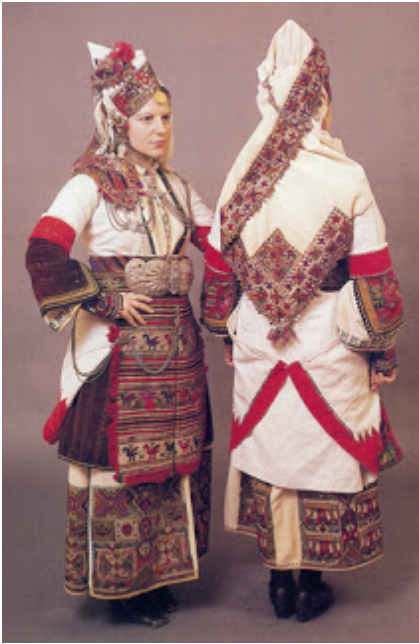
Νυφική φορεσιά Επισκοπής