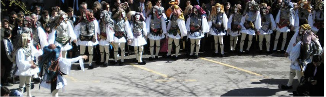
Οι Γενίτσαροι κι οι Μπούλες της Νάουσας

Στη Μακεδονία συναντούμε μεγάλη ποικιλία χορών, μουσικής και ρυθμών που ανήκουν στην χορευτική παράδοση είτε των παλιότερων ντόπιων πληθυσμών είτε των προσφύγων από τη Θράκη, τη Μικρά Ασία και τον Πόντο και εγκαταστάθηκαν στη Μακεδονική γη μετά το 1923. Συναντούμε χορούς κυκλικούς και αντικριστούς, ανδρικούς, γυναικείους και κοινούς. Στους χορούς αυτούς εμφανίζονται επιρροές από τη Θράκη, την Ήπειρο, τη Θεσσαλία, το Αιγαίο, καθώς και από τις σλάβικες φυλές των βορείων συνόρων της.