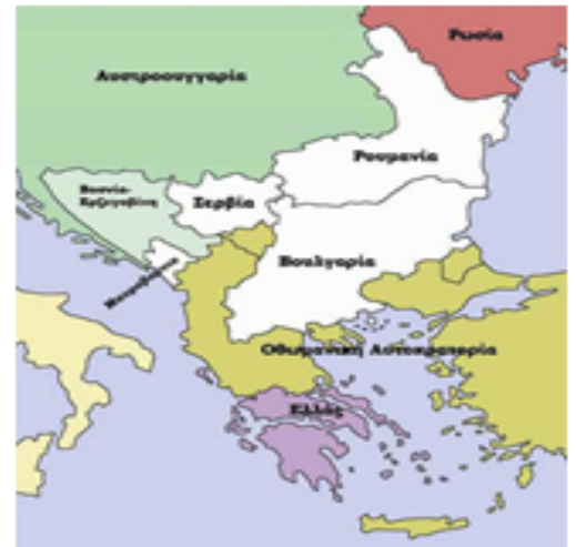
Ο χάρτης των Βαλκανίων σύμφωνα με τη Συνθήκη του Αγίου Στεφάνου