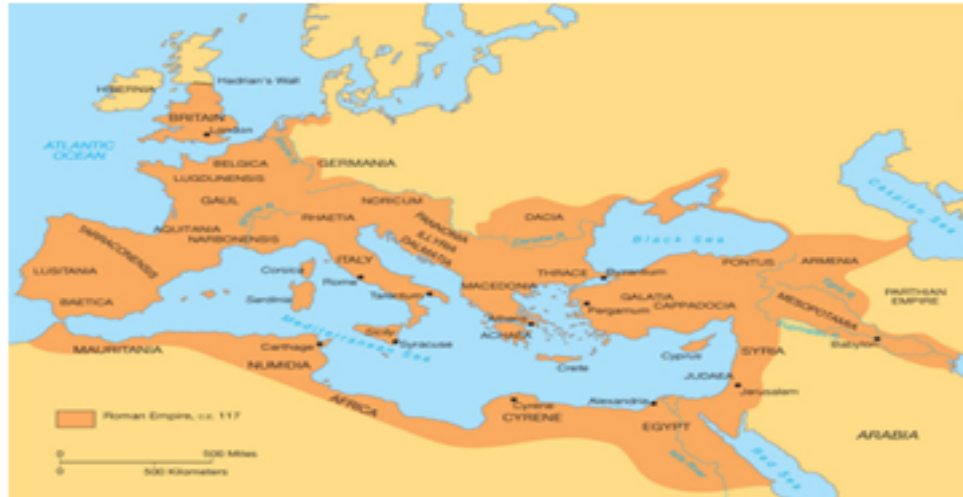
Geographical Resources: A Rise of Empire