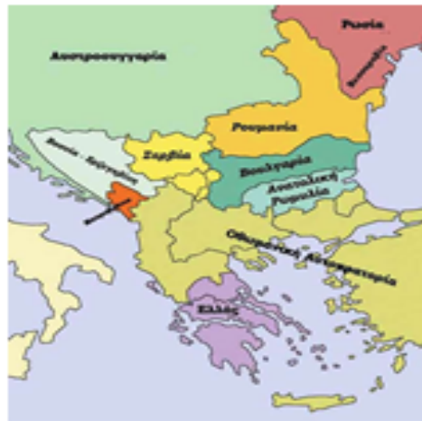
Ο χάρτης των Βαλκανίων σύμφωνα με τη Συνθήκη του Βερολίνου