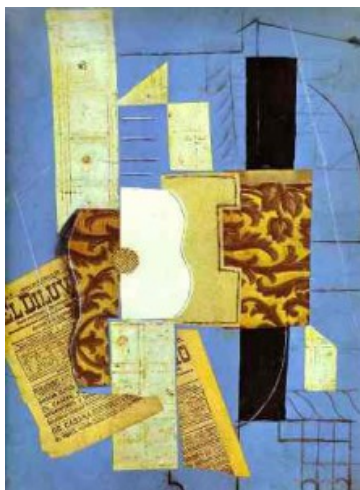
«Κιθάρα» (Guitar), 1913, Μικτή τεχνική, Μουσείο μοντέρνας Τέχνης Νέα Υόρκη

Η κυβιστική περίοδος των δυο πρωτοπόρων (Πικάσο, Μπρακ) εκτείνεται χρονολογικά από το 1907 έως το 1920 και μπορεί να χωριστεί σε δυο βασικές φάσεις: 1ον στην αναλυτική (1907-1912) {ανάλυση των μορφών ,παρουσιάζοντας διαφορετικές όψεις ενός αντικειμένου} και 2ον στην συνθετική (1912-1920) {τα έργα δημιουργούνται από την σύνθεση διαφόρων υλικών}.