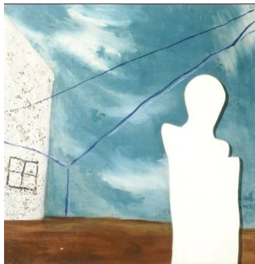
ΑΓΓΕΛΟΣ ΣΠΑΧΗΣ (το πρώτο του έργο) "το αίνιγμα της φυσιognωμίας του ανθρώπου" (1932)

Η τεχνική του κολάζ στην Ελλάδα ξεκίνησε στις αρχές του 20ου αιώνα. Εμφανίζονται δειλά κάποιες προσπάθειες με τον Άγγελο Σπαχή και τον Οδυσσέα Ελύτη, παρουσιάζοντας συνθέσεις ιδιαίτερα τολμηρές για την εποχή τους. Με το κίνημα της Αφαίρεσης τη δεκαετία του 1950-60, το κολάζ κατόρθωσε να αποκτήσει το δικό του χώρο στη ζωγραφική. Σκοπός της είναι η αντιμετώπιση της μορφής στο σύνολο της και όχι στις επιμέρους λεπτομέρειες.