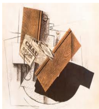
Μπρακ, «Νεκρή φύση επάνω σε τραπέζι», 1914.

Θεωρείται ότι η τεχνική του κολάζ εφευρέθηκε από τον Georges Braque το 1910,