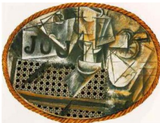
Νεκρή φύση με πλεχτό καρέκλας» (Still-Life with Chair Caning). 1911/12, λάδι και κολάζ σε καμβά, Μουσείο Πικάσο, Παρίσι, Γαλλία.

Το κολάζ, στη μοντέρνα έννοια του είχε γεννηθεί και κυριάρχησε σε όλες τις μορφές της τέχνης κατά τη διάρκεια του 20ου αιώνα. Από το 1912 και οι δυο καλλιτέχνες συστηματικά χρησιμοποιούν αυτή την τεχνική κάνοντας το κολάζ χαρακτηριστική τεχνική του συνθετικού κυβισμού. \