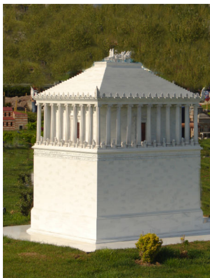
Πιθανή μορφή Μαυσωλείου Αλικαρνασσοῦ (αντίγραφο)

Υπολογίζεται ότι το ύψος του Μαυσωλείου ήταν 45 μέτρα και ήταν λευκού χρώματος. Οι Έλληνες αρχιτέκτονες, Σάτυρος και Πύθεος, το σχεδίασαν και άλλοι τέσσερις Έλληνες γλύπτες το φιλοτέχνησαν. Μια τόσο μεγάλη και περίτεχνη κατασκευή, όπως το Μαυσωλείο, με έναν εξαιρετικά πλούσιο γλυπτό διάκοσμο, οπωσδήποτε θα απαιτούσε πολύ καιρό για την ολοκλήρωσή του.